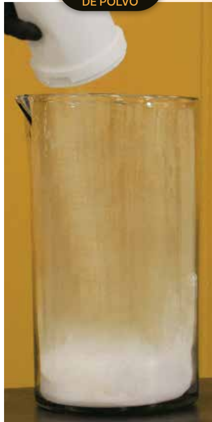
ADHESIVO PAM® ECOGEL bajas emisiones de polvo