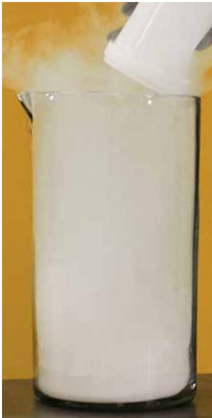
ADHESIVO CONVENCIONAL DE OTRAS MARCAS...

Construction Solutions ofrece al profesional un producto que permite su manipulación y mezcla con bajas emisiones de polvo.